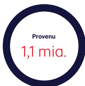
Figur 1. Nøgletal for modregning i overskydende skat fra 2018

Gældsstyrelsen har foreløbigt inddrevet ca. 1,1 mia. kr. ved at modregne gæld i overskydende skat.